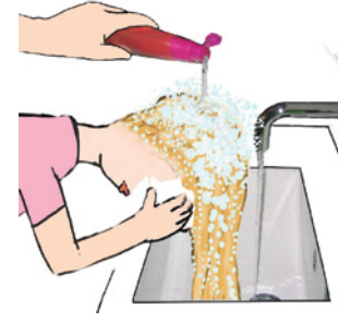
saç yıkamak Haare waschen