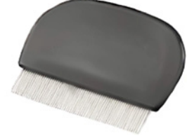
bit tarağı Nissenkamm