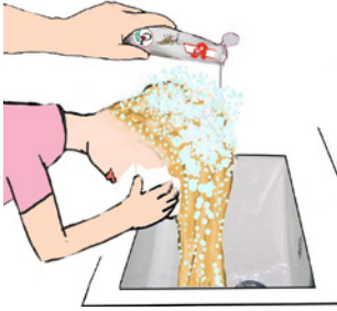
Saçı çözeltiyle ıslatın. Haare mit der Lösung durchtränken