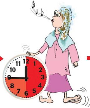
etki süresi genelde 30-45 dakika meistens 30 - 45 Minuten Einwirkzeit (ilac kulanıma tarifine muhakak dikat et- meli - unbedingt Packungsbeilage genau beachten)