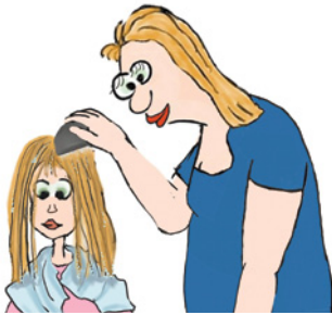
Saçı 1., 5., 9. ve 13. gün ıslak tarayın. Die nassen Haare am 1., 5., 9. und 13. Tag auskämmen.