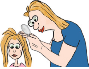
baş/saç muayene 1x/gün Kopf/Haaruntersuchung 1x/Tag